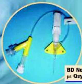
BD Nexiva™ με Qsyte™