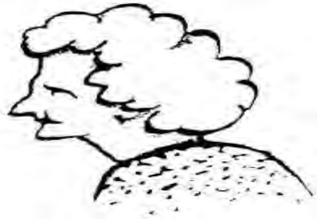
The qualities of an ICD/ICN.

Ο ρόλος της ΝΕΛ είναι δύσκολος, υπεύθυνος, πολύμορφος και απαιτεί χαρίσματα όπως αναφέρει ο Dacchner (1988)